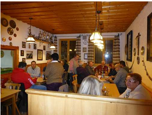
Beim gemütlichen Beisammensein