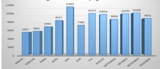
Zugriffe auf Homepage in 2015